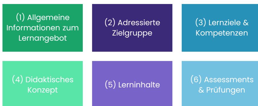
Abbildung 2: Didaktische Kriterien zur Konzeption und Entwicklung digitaler Lernangebote für den KI-Campus

Für die didaktische Konzeption und Entwicklung digitaler Lernangebote für den KI-Campus sind die folgenden sechs Kategorien zentral: