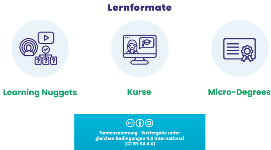
Abbildung 1. Lernformate auf dem KI-Campus

Um den übergeordneten Feldern Künstlicher Intelligenz (Grundlagenkompetenzen, bereichsspezifische Kompetenzen sowie interdisziplinäre Kompetenzen und Fragestellungen) sowie der digitalen Repräsentationsform gerecht zu werden sind für den KI-Campus didaktisch zukunftsfähige Lernformate wichtig. Die digitalen Lernangebote sollten im Regelfall eine Einbettung in analoge Lernsettings bzw. Blended-Learning-Konzepte ermöglichen. Hierzu zählen beispielsweise: